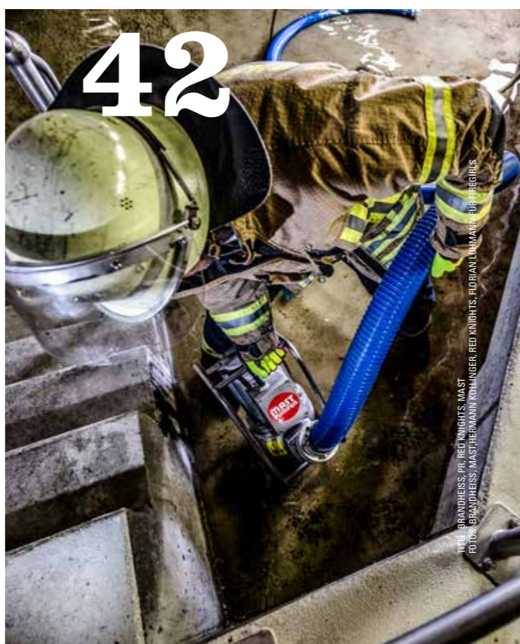
TÜCKER BRANDHEISS, PR. RED KNIGHTS, MAST