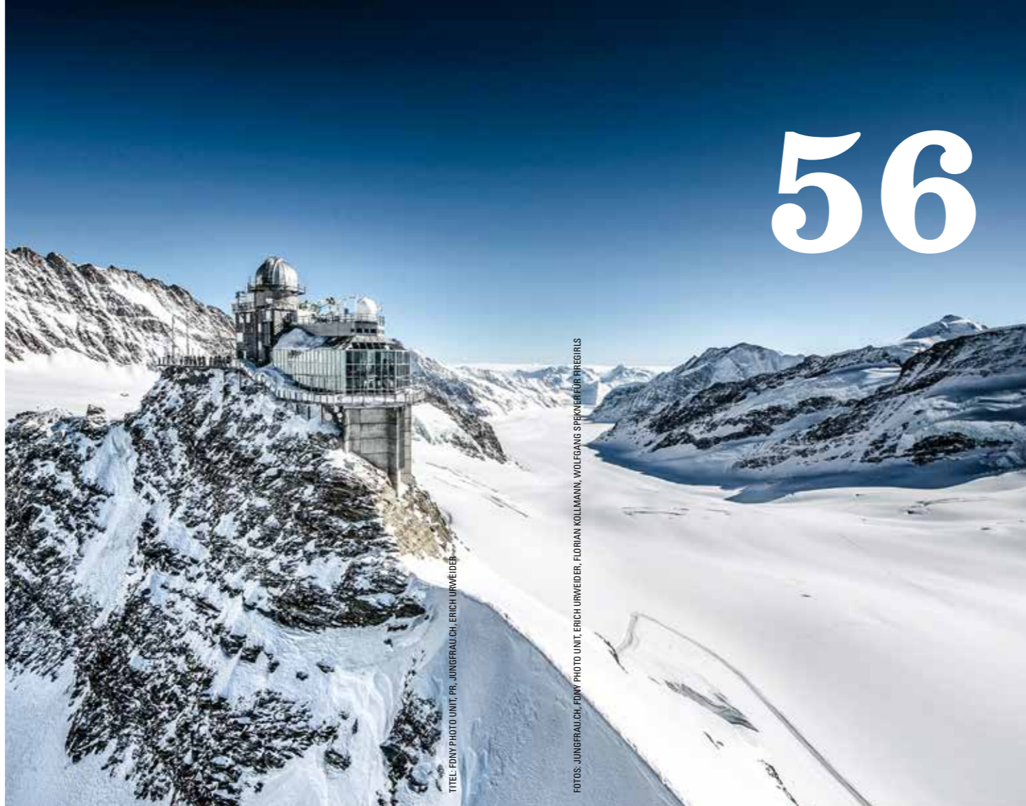
TITEL: FDNY PHOTO UNIT, PR. JUNGFRAUCH, ERICH URWEIDER